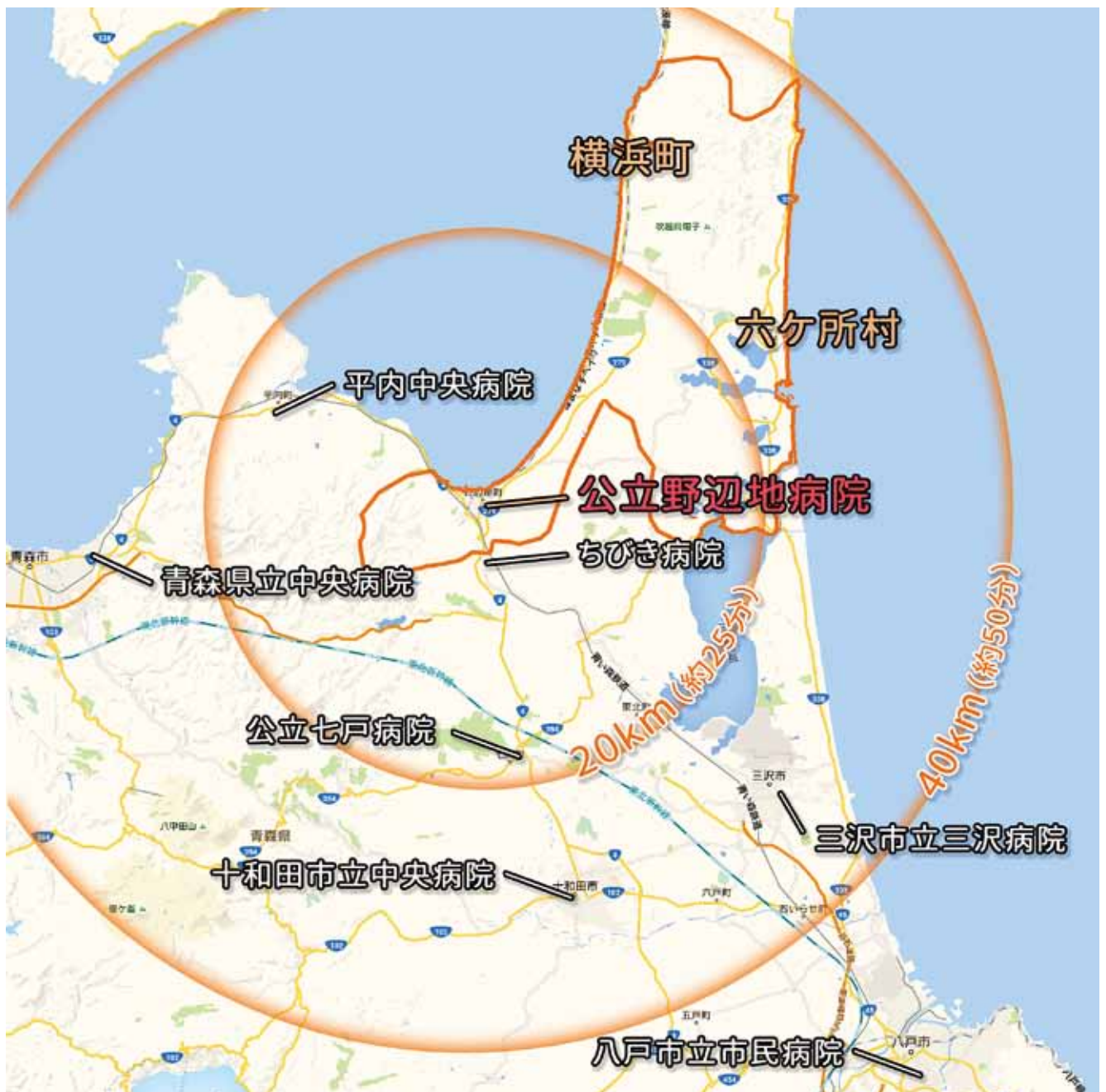
野辺地病院と周辺病院

し、その気の無い職員は担当も変えざるをえませんでした。今年野辺地病院に対する機能評価機構の再調査の年でもあります。評価機構に対しては、野辺地病院の目的は本当の患者中心の医療を行うことだと考えていますので、この病院を取り巻く状況を少しでも改善できるように努力していると思っています。この病院を利用されている地域の皆様には、なにとぞ病院に対する批判も応援もたくさんいただけたらと思っています。