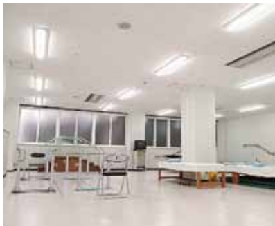
リハビリテーション科