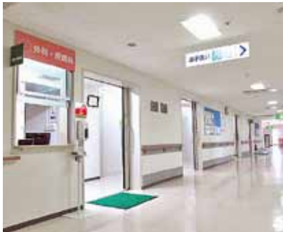
外科・皮膚科待合室

平成25年度の中央待合室に続き、一部の外来診療科とリハビリテーション科のリニューアル、南2階病棟へ個室病棟の新設を行いました。LED照明で環境にも配慮しております。明るくなった室内で皆様をお迎えします。