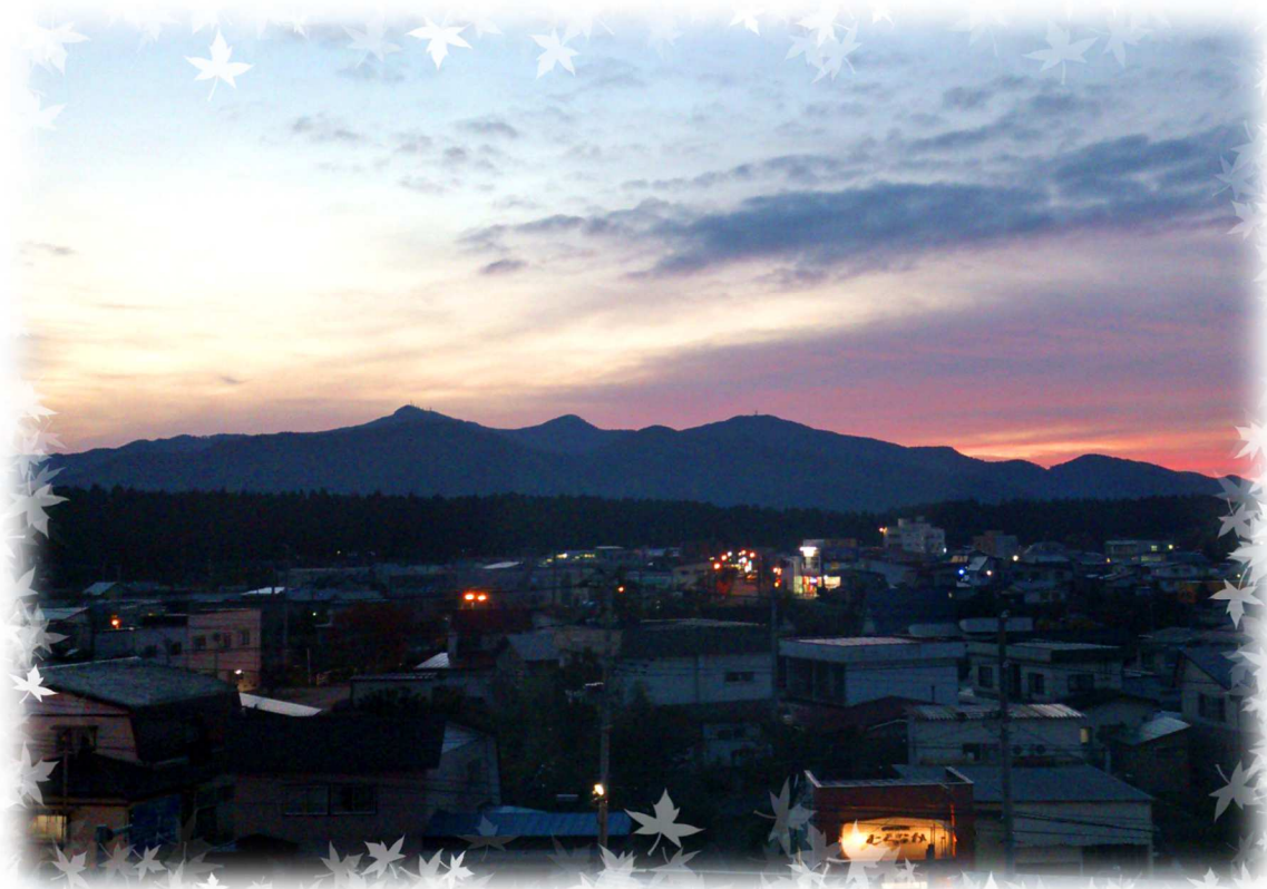
夕暮れの烏帽子岳