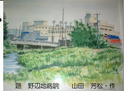
題 野辺地病院 山田 芳松・作

わかすげの由来：菅（すげ）は、繁殖力の強い植物で、古来から当地域には、菅笠、菅畳、菅枕等々生活に欠かせない貴重なものであった。