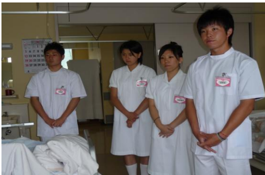
「今日一日看護体験させていただきます。 よろしくお願いします。」