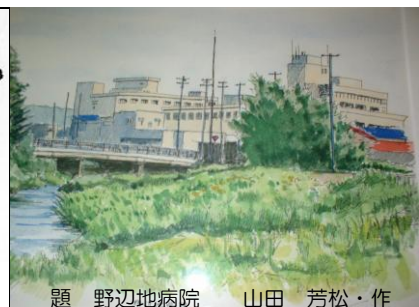
題 野辺地病院 山田 芳松・作

わかすげの由来：菅（すげ）は、繁殖力の強い植物で、古来から当地域には、菅笠、菅畳、菅枕等々生活に欠かせない貴重なものであった。